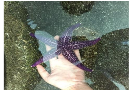
新潟市水族館マリニピア日本海