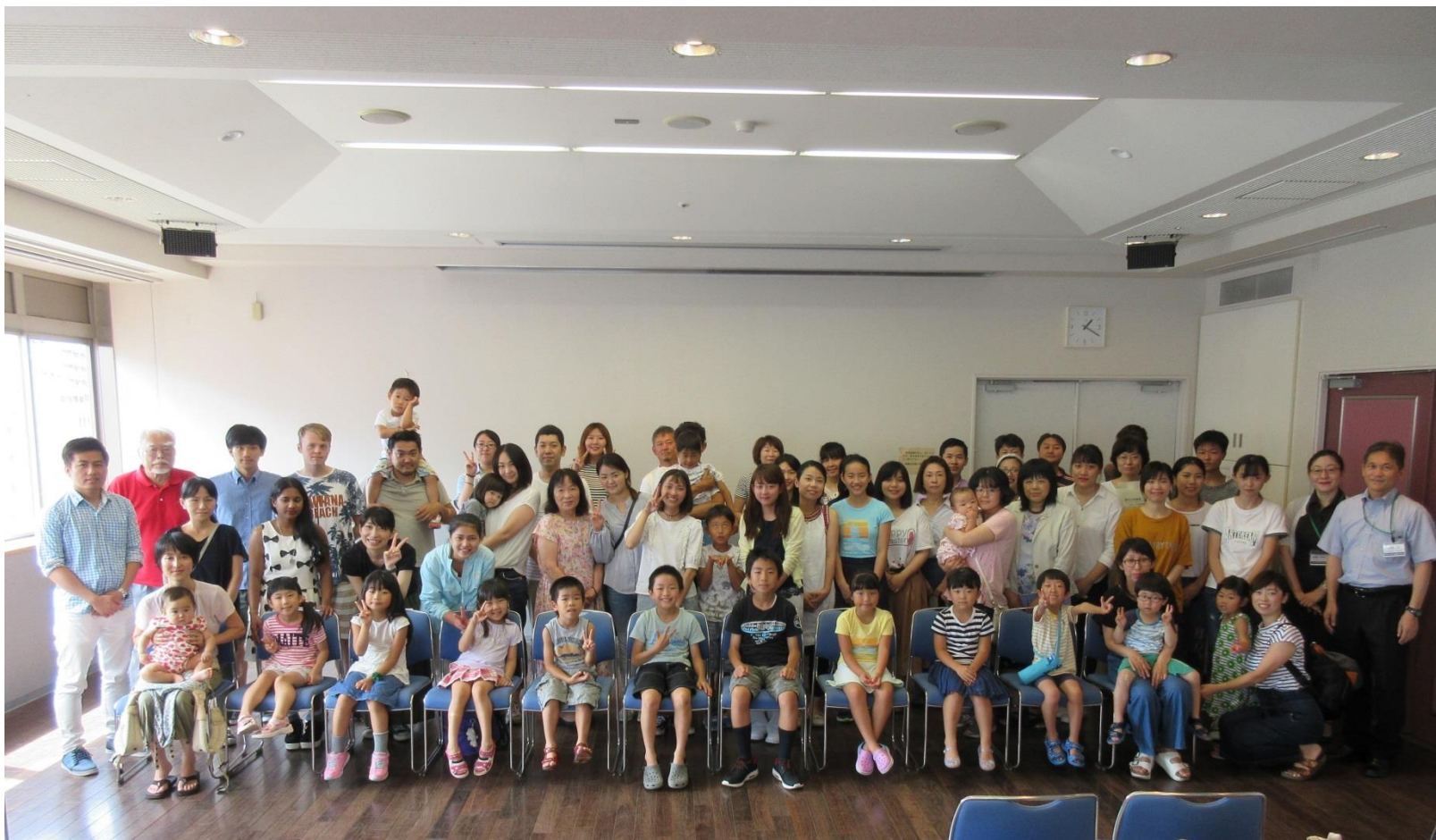
対面式での集合写真（平成 30 年 7 月 28 日）