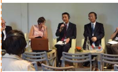
質問に答える篠田市長